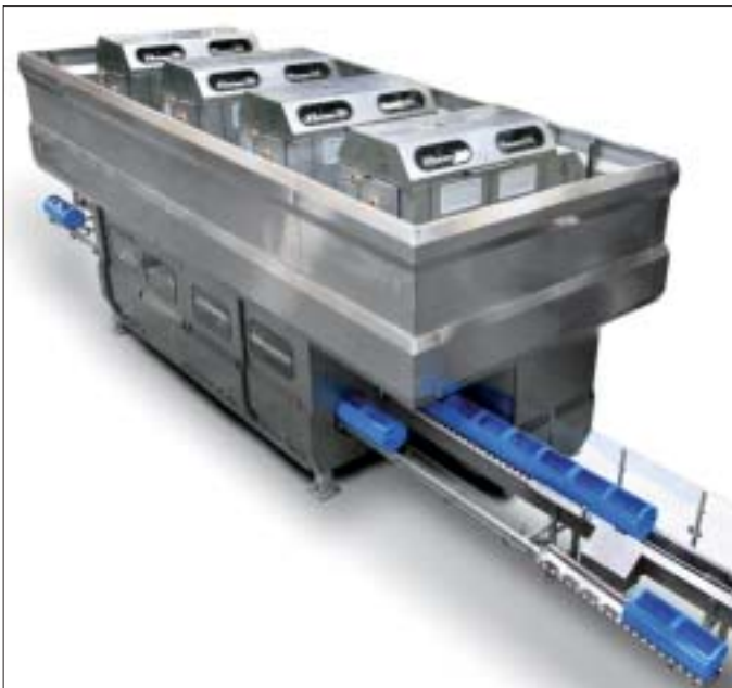
Equipo de altas presiones (NC Hyperbaric 420i), actualmente el de mayor capacidad de producción, que se instalará próximamente en APA Processing en la Zona Franca de Barcelona.

La utilización de las altas presiones ( High Pressure Processing , HPP) se inició en la industria química, cerámica, metalúrgica y plásticos. Su aplicación a los alimentos fue experimentada por primera vez en la conservación de leche (Hite, 1899), frutas y vegetales (Hite, Giddingsy Weakly, 1914), pero no fue hasta el año 1990 cuando se estableció en Japón la empresa pionera en el uso de las altas presiones en alimentos, Meidi-ya, lanzando al mercado mermeladas, jaleas de fruta y salsas vegetales, envasadas y procesadas en frío (Thakur and Nelson, 1998).