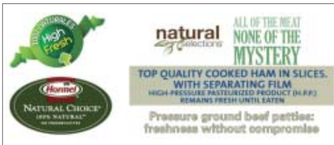
Algunas de las menciones utilizadas respecto al tratamiento mediante altas presiones hidrostáticas.

mentados, salchichas cocidas, son actualmente procesados mediante altas presiones, manteniendo el sabor fresco y las propiedades sensoriales del producto durante toda una vida comercial extendida, y reduciendo muy significativamente los riesgos asociados a patógenos (Morales, et al. 2006, Garriga et al. 2004).