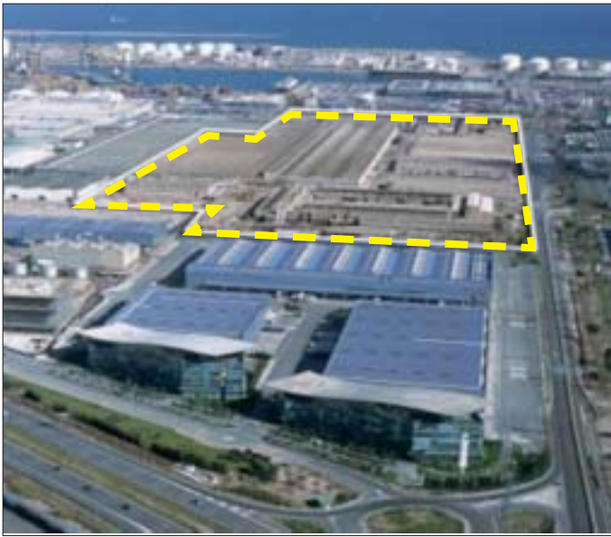
Zona de innovación del Consorci de la Zona Franca de Barcelona.

En Estados Unidos y Canadá, la tecnología de altas presiones en productos cárnicos se ha extendido rápidamente porque la propia Administración (FDA, USDA), aconseja y estimula el uso de las altas presiones como tecnología post-letal para reducir los riesgos frente a Listeria en productos ready to eat .