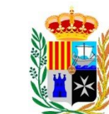
Ajuntament de Sant Carles de la Ràpita